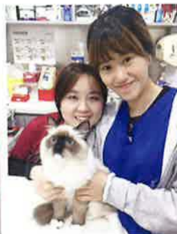
貓咪日漸健康，大家都倍感欣慰。