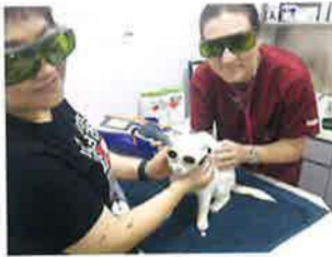
進行治療前，獸醫、主人、Lui Lui都已戴上眼罩，避免光線直射眼球。