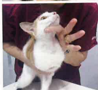
獸醫會先幫貓咪做初步評估，再視乎病情提供不同治療方法。