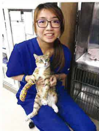
護士細心幫貓咪綁好繃帶，以防貓咪活動時傷到舊患。