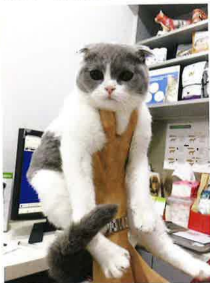
寵物有任何問題，主人亦應及早求診。